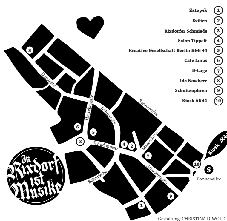
Gestaltung: CHRISTINA DIWOLD

Sisterbutterfly myspace.com/sisterbutterfly