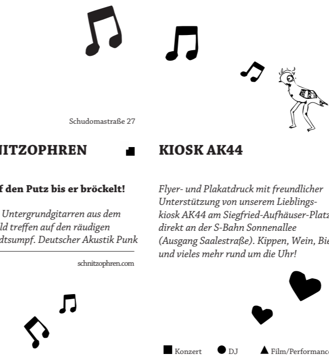
„In Rixdorf ist Musike“ ist eine Gemeinschaftsaktion von: B-Lage, Ida Nowhere und Schnitzophren.

Flyer- und Plakatdruck mit freundlicher Unterstützung von unserem Lieblingskiosk AK44 am Siegfried-Aufhäuser-Platz direkt an der S-Bahn Sonnenallee (Ausgang Saalestraße). Kippen, Wein, Bier und vieles mehr rund um die Uhr!