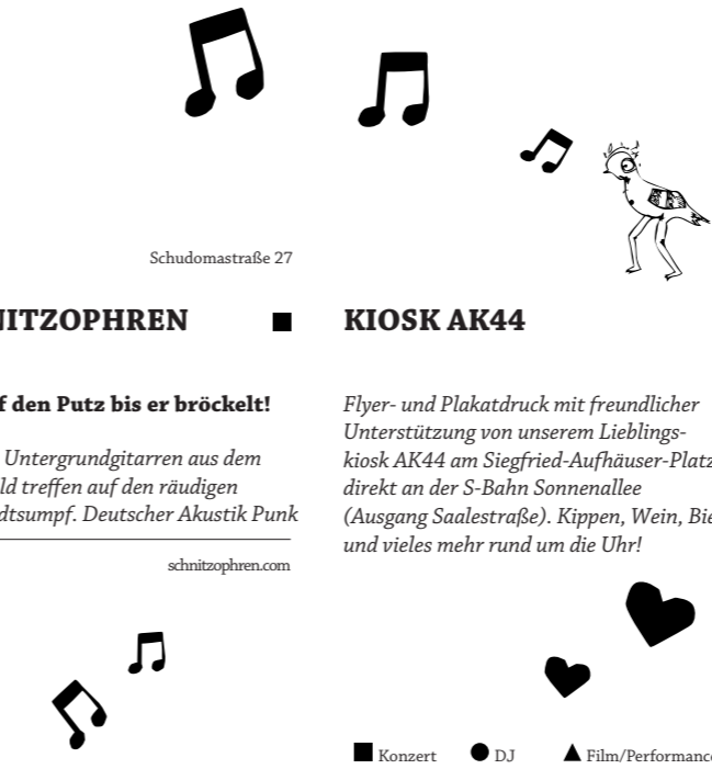
„In Rixdorf ist Musike“ ist eine Gemeinschaftsaktion von: B-Lage, Ida Nowhere und Schnitzophren.

Flyer- und Plakatdruck mit freundlicher Unterstützung von unserem Lieblingskiosk AK44 am Siegfried-Aufhäuser-Platz direkt an der S-Bahn Sonnenallee (Ausgang Saalestraße). Kippen, Wein, Bier und vieles mehr rund um die Uhr!