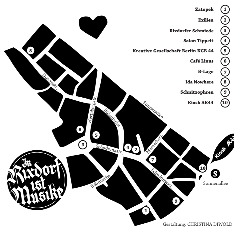
Gestaltung: CHRISTINA DIWOLD

Sisterbutterfly myspace.com/sisterbutterfly